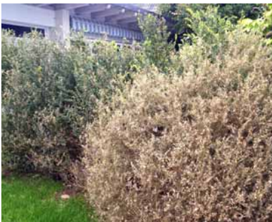
Kahlfrass durch den Buchsbaumzünsler

Für unsere Flora zu warm, war der März für den gefräßigen Buchsbaumzünsler ideal zur weiteren Verbreitung in unseren Gärten. Die ersten Fälle hatten wir anfangs April in Zürich und Dietikon, dann anfangs Mai in Baltenschwil und Bernold und bereits schon Ende Mai in Kindhausen. In den letzten Jahren trat der Buchsbaumzünsler erst vor den Sommerferien