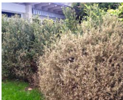
Kahlfrass durch den Buchsbaumzünsler

Für unsere Flora zu warm, war der März für den gefräßigen Buchsbaumzünsler ideal zur weiteren Verbreitung in unseren Gärten. Die ersten Fälle hatten wir anfangs April in Zürich und Dietikon, dann anfangs Mai in Baltenschwil und Bernold und bereits schon Ende Mai in Kindhausen. In den letzten Jahren trat der Buchsbaumzünsler erst vor den Sommerferien